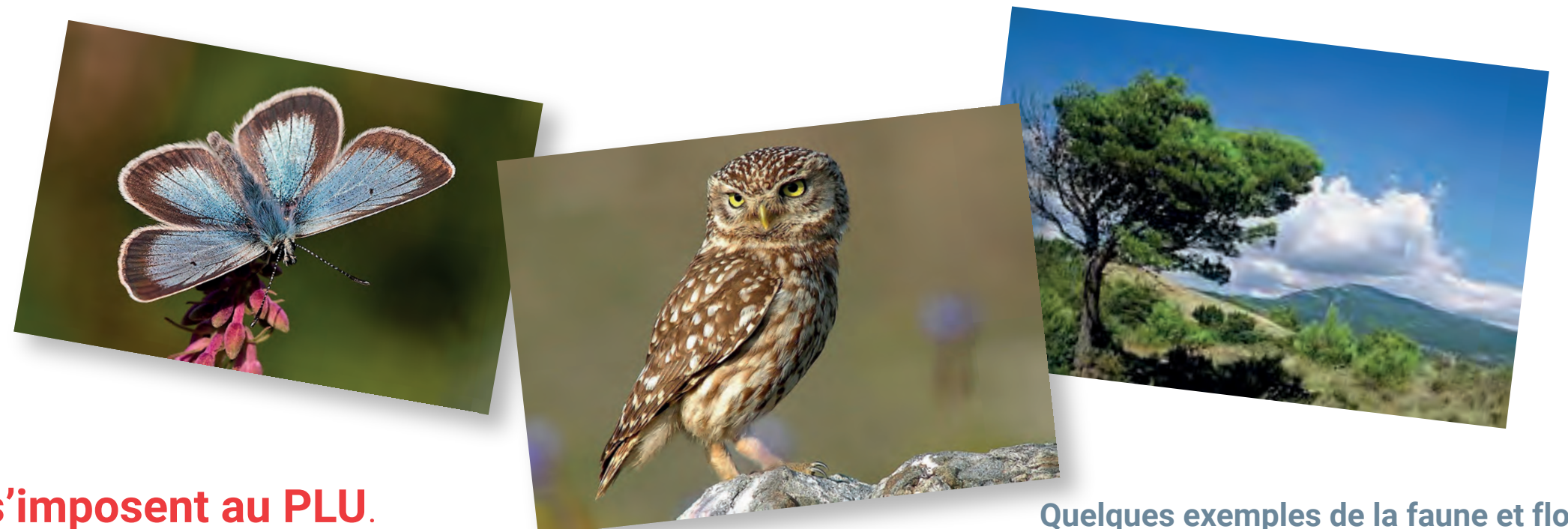
Quelques exemples de la faune et flore typiques des milieux naturels du Castellet

Il est aussi question de santé humaine avec la prise en compte dans les choix d'aménagement des nuisances sonores et de la qualité de l'air (autoroute et grands axes routiers, aéroport, circuit automobile...), et plus généralement des conséquences du changement climatique sur nos territoires (hausse des températures, événements climatiques plus sévères...)